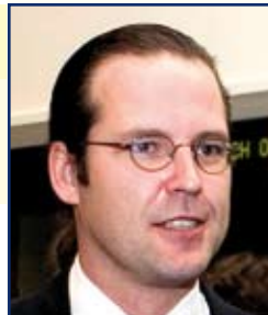
M. Anders Borg, Ministre des finances