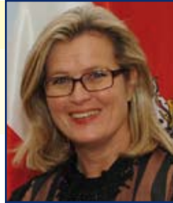
Mme Ursula Plassnik, Ministre fédéral des affaires étrangères et internationales