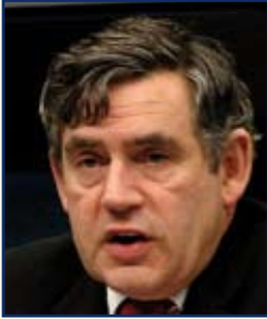
M. Gordon Brown, Premier ministre