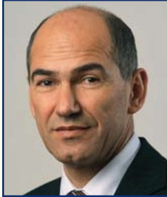
M. Janez Janša,