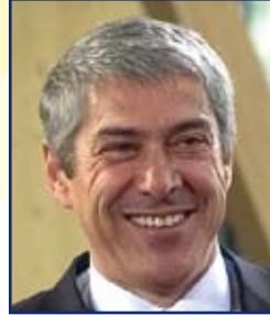
M. José Sócrates, Premier ministre