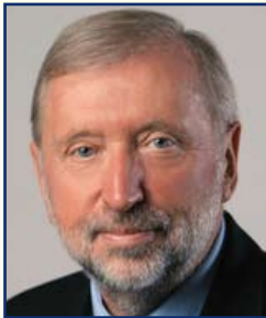
M. Dimitrij Rupel,