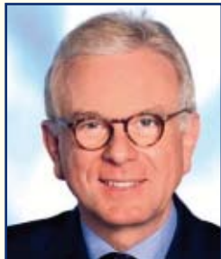
M. Hans-Gert Pöttering, Président