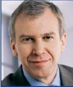
M. Yves Leterme, Premier ministre