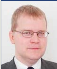
M. Urmas Paet, Ministre des affaires étrangères