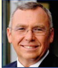
M. Alfred Gusenbauer, Chancelier fédéral