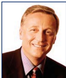
M. Mirek Topolánek,