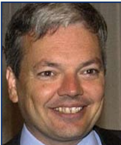
M. Didier Reynders, Vice-premier ministre et Ministre des finances et des réformes institutionnelles