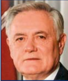
M. Valdas Adamkus, Président de la République