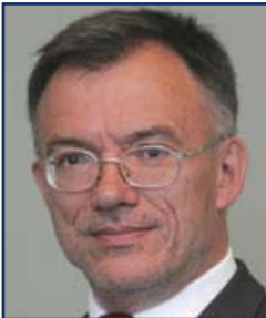
M. Petras Vaitiekûnas, Ministre des affaires étrangères