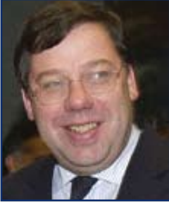
M. Brian Cowen, Premier ministre