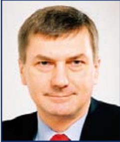
M. Andrus Ansip, Premier ministre