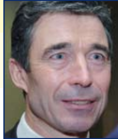
M. Anders Fogh Rasmussen, Premier ministre