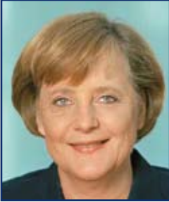
Mme Angela Merkel, Chancelière fédérale