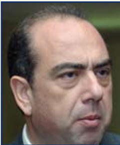
M. Markos Kyprianou, Ministre des affaires étrangères