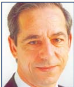
M. Lawrence Gonzi,