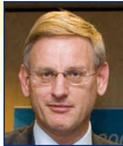
M. Carl Bildt, Ministre des affaires étrangères