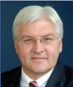
M. Frank-Walter Steinmeier, Vice-chancelier et Ministre fédéral des affaires étrangères