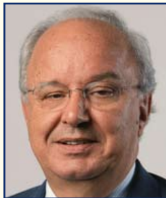
M. Andrej Bajuk,