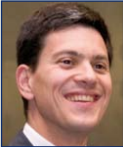
M. David Miliband, Ministre des affaires étrangères et du Commonwealth