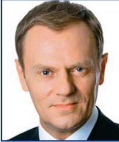
M. Donald Tusk, Premier ministre