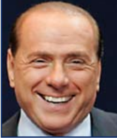
M. Silvio Berlusconi, Premier ministre