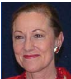
Mme Benita Ferrero-Waldner, Membre