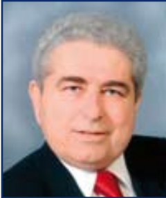
M. Dimitris Christofias, Président de la République