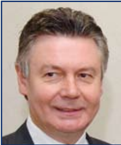
M. Karel De Gucht, Ministre des affaires étrangères