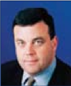
M. Brian Lenihan, Ministre des finances