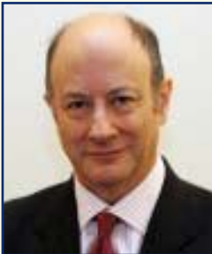
M. Jan Vincent-Rostowski, Ministre des finances