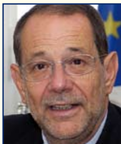
M. Javier Solana, Secrétaire général/Haut représentant pour la PESC