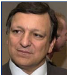
M. José Manuel Barroso Président