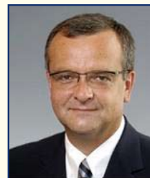
M. Miroslav Kalousek,

Vice-premier ministre, chargé des affaires européennes