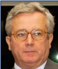
M. Giulio Tremonti, Ministre de l'économie et des finances