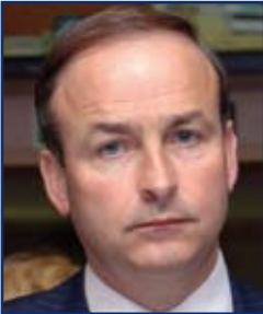
M. Micheál Martin, Ministre des affaires étrangères