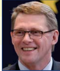
M. Matti Vanhanen, Premier ministre