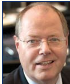
M. Peer Steinbrück, Ministre fédéral des finances