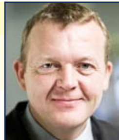
M. Lars Løkke Rasmussen, Ministre des finances