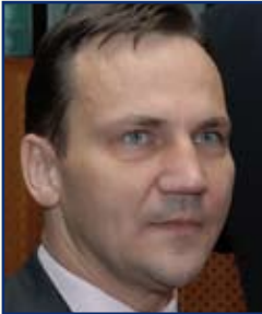
M. Radosław Sikorski, Ministre des affaires étrangères