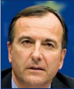
M. Franco Frattini, Ministre des affaires étrangères