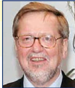
M. Per Stig Møller, Ministre des affaires étrangères