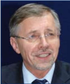
M. Gediminas Kirkilas, Premier ministre