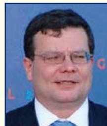
M. Alexandr Vondra,

Vice-premier ministre, chargé des affaires européennes