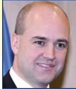
M. Fredrik Reinfeldt, Premier ministre