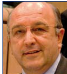
M. Joaquín Almunia, Membre