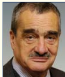
M. Karel Schwarzenberg,