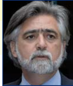
M. Luís Amado, Ministre d'Etat, Ministre des affaires étrangères