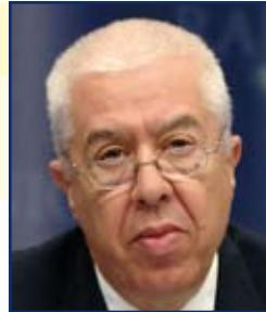
M. Fernando Teixeira dos Santos, Ministre d'État, Ministre des finances