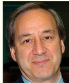
M. Giorgos Alogoskoufis,