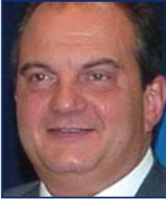
M. Kostas Karamanlis,