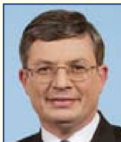
M. Tonio Borg,

Vice-premier ministre et ministre des affaires étrangères