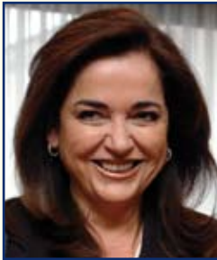
Mme Dora Bakoyannis,