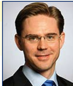
M. Jyrki Katainen, Vice-premier ministre et Ministre des finances