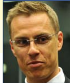
M. Alexander Stubb, Ministre des affaires étrangères